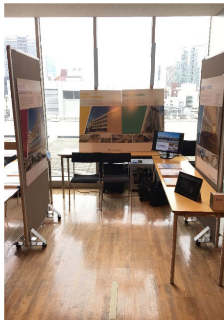
技術展示コーナー イメージ写真