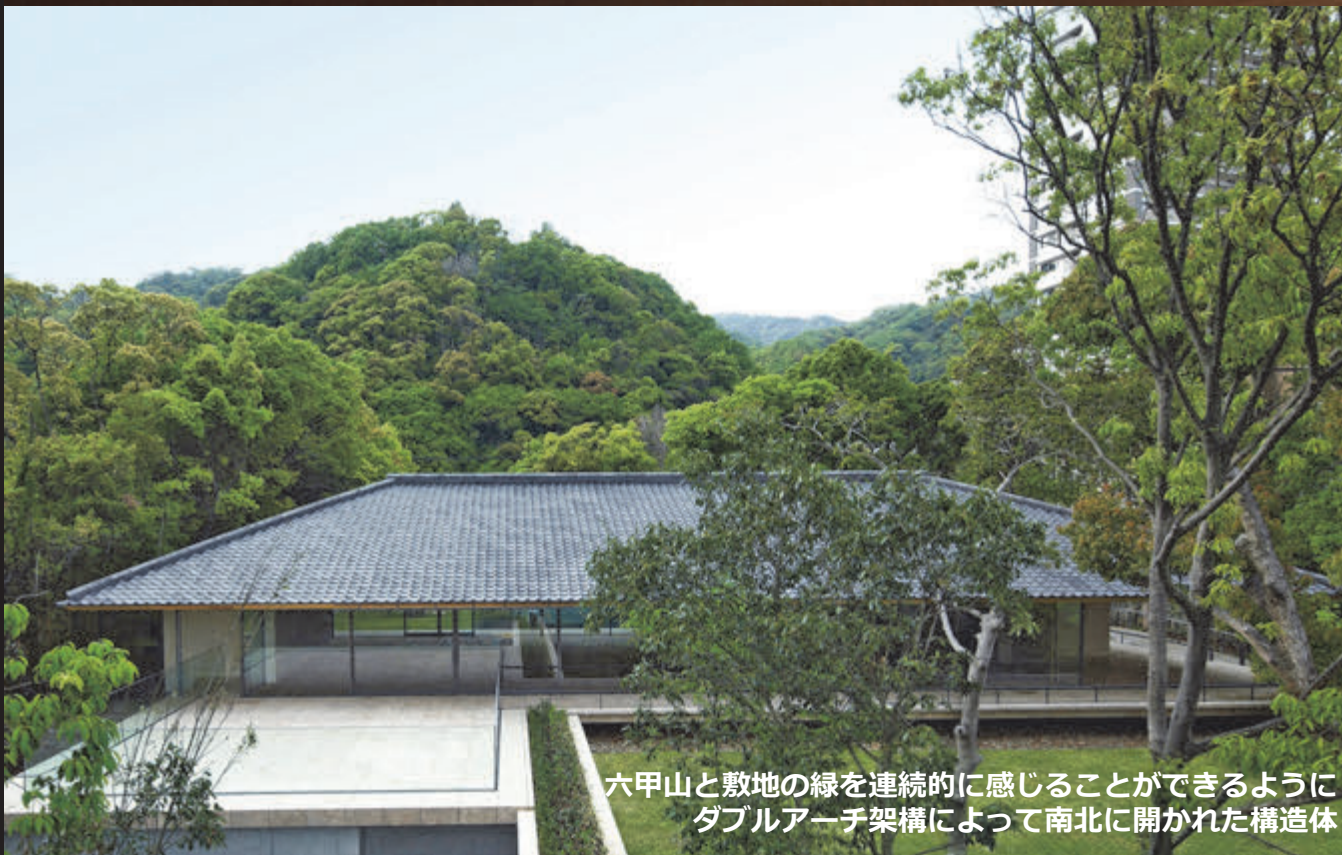
六甲山と敷地の緑を連続的に感じることができるよう ダブルアーチ架構によって南北に開かれた構造体