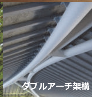
ダブルアーチ架構