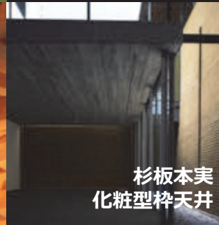
杉板本実 化粧型枠天井