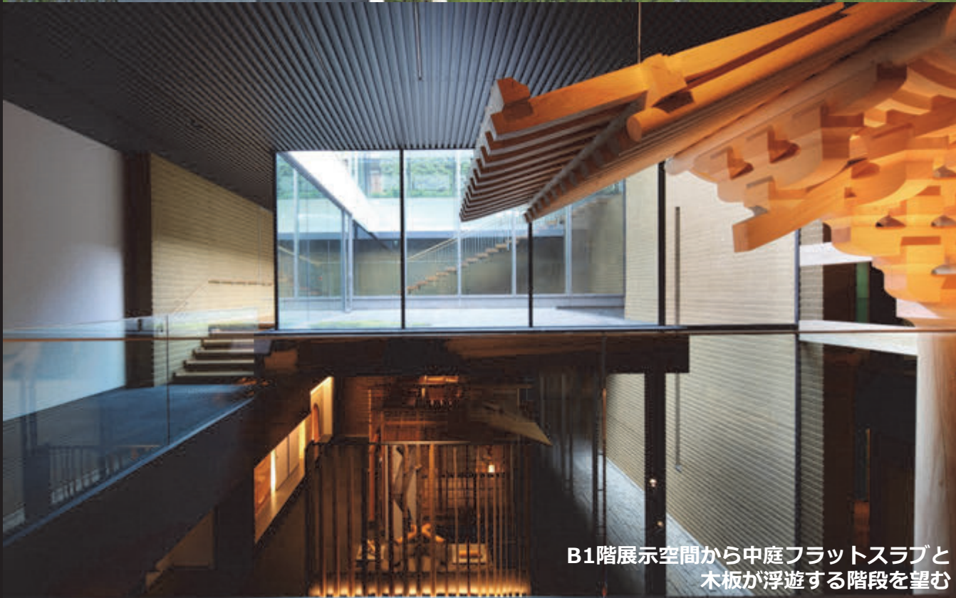
B1階展示空間から中庭フラットスラブと 木板が浮遊する階段を望む