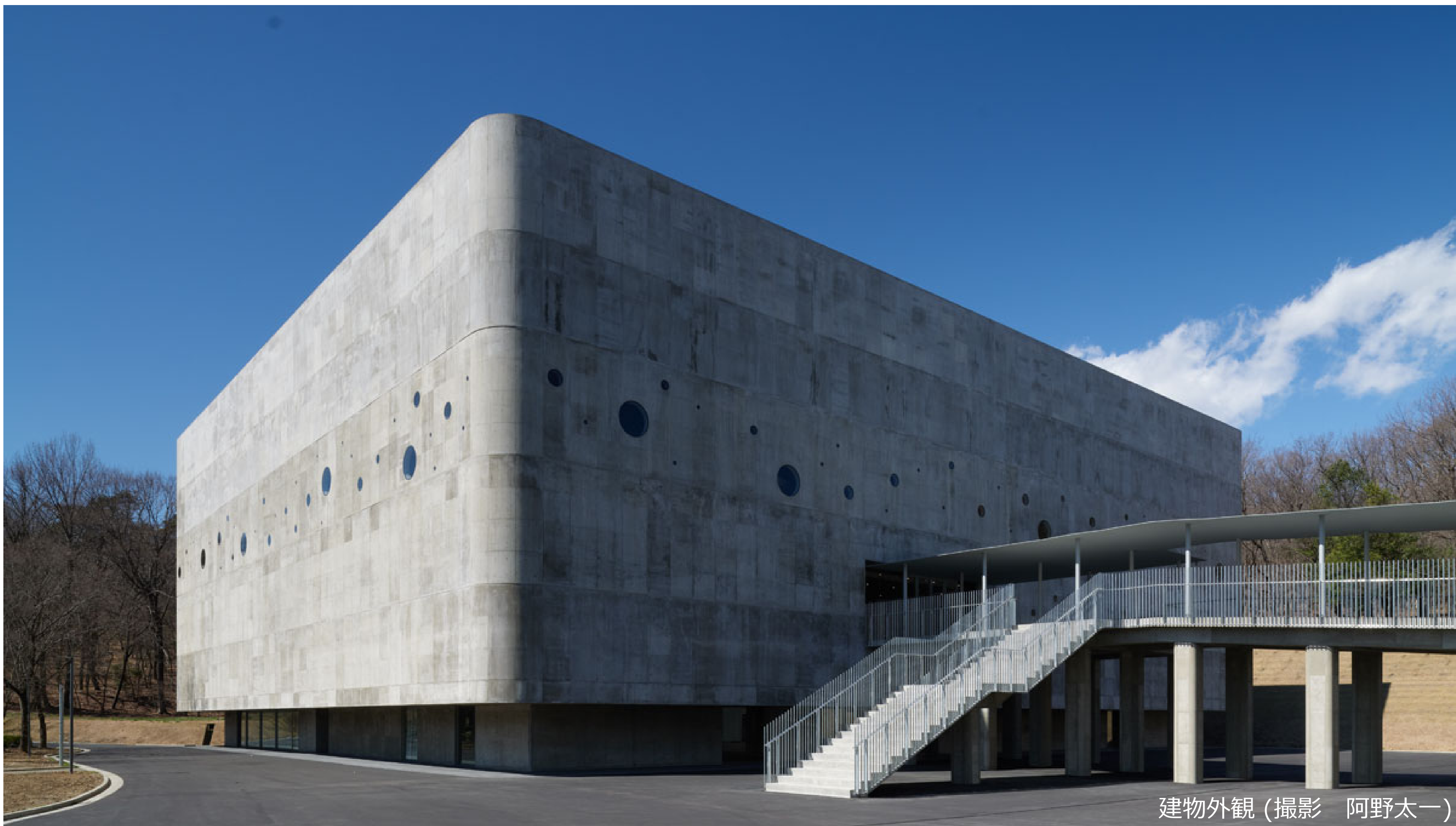
建物外観