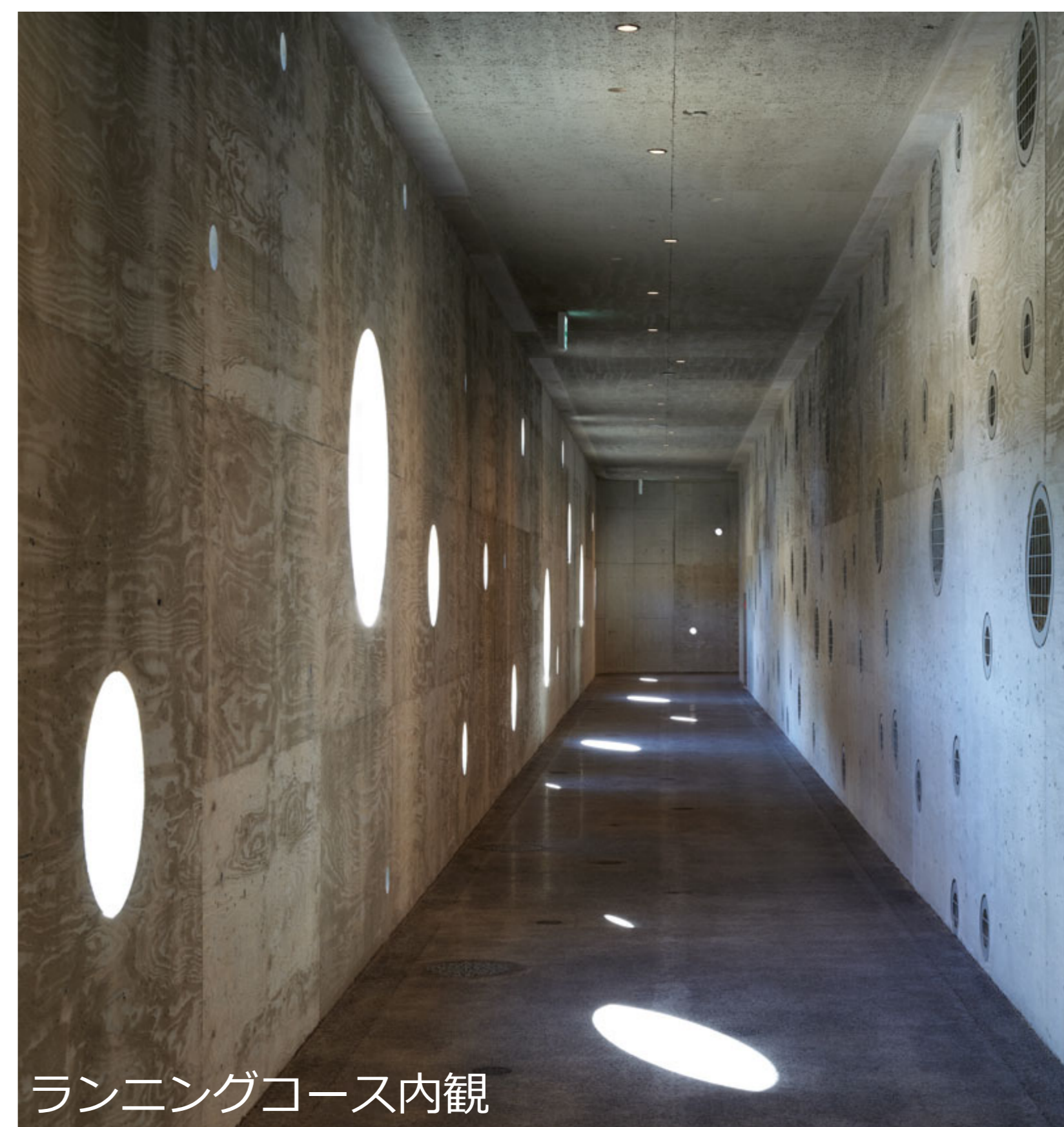
ランニングコース内観